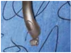
Haken für Garderobe