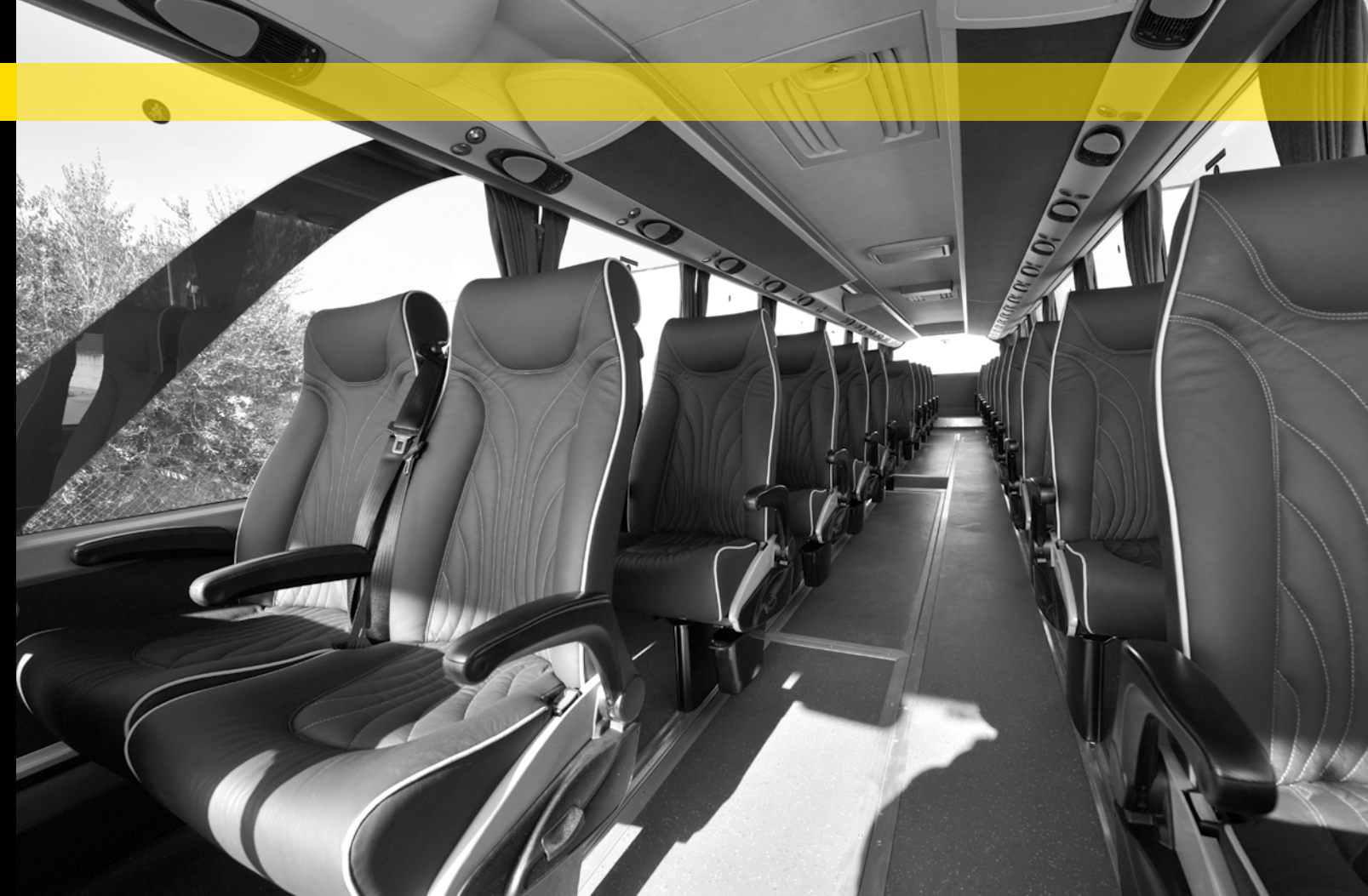
Eine elegante Ausstattung mit Politecnica Relax GTV

2) "Ars Renovandi" ist die Fähigkeit, Gewissheiten in Frage zu stellen und mit Leidenschaft zu arbeiten, um die Firma ständig zu verbessern, damit unsere Kunden zufrieden sind.