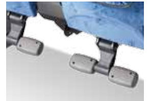
Klappbar (2 Stellungen)