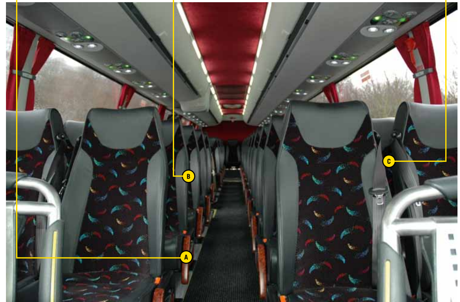
Eine sehr schöne Ausstattung mit den Sitzen Politecnica Relax Turismo (Option Sportbezug und- Keder)