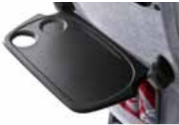
klappbares Rückseite- Tischchen