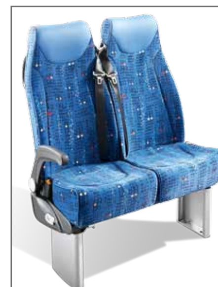
Relax Turismo mit Keder und Kopfstütze-Einsatz