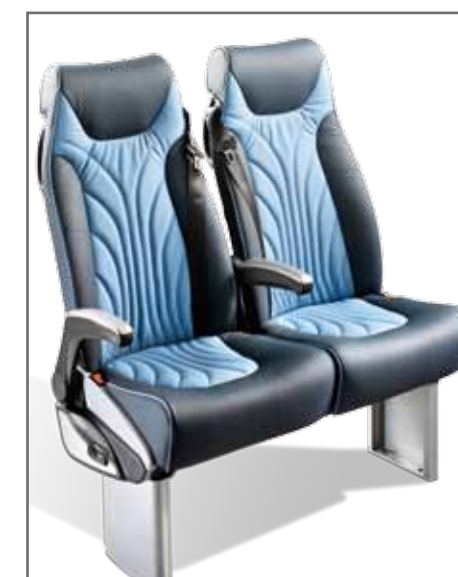
Relax GTV mit echtem Leder bezogen: hier ein zweifarbiges Sitzmodell.

Gestalten Sie Ihren Sitz persönlich und wählen Sie unter verschiedenen Bezugsmaterialien und Farben. Der Standard-Sitz Relax ist mit einem Standard Textil (Rückseite und Vorderseite) bezogen und hat 2 Klettbänder. Besonders beliebt ist die Kombination von Kopfstütze und Keder, beide aus Leder. Einfarbige oder zweifarbig Ledereinsätze aus echtem Leder auf der Rücklehne und für das Sitzkissen werden auch oft gewählt. Dieser Sitz ist auch mit hochwertigen Seitenflaps erhältlich. Sie können auch Ihren Sitzbezug auf der Abbildung oben persönlich gestalten oder Politecnica kontaktieren, um eine Vorabansicht Ihres Sitzes zu bekommen.