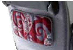
Relax Turismo Zeitungshaltertasche mit Textilrändchen