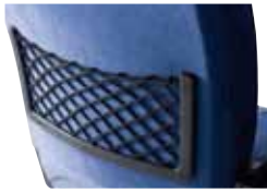
Zeitungshalternetz aus Kunststoff