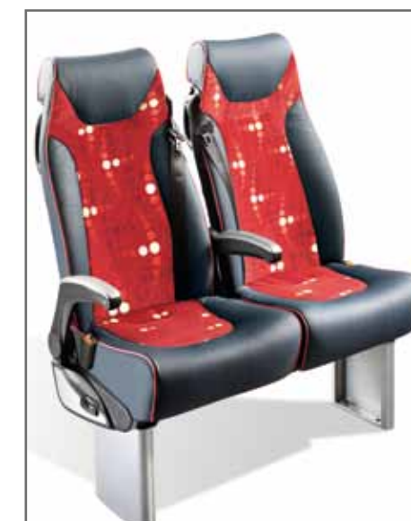
Relax Turismo mit Sportsrändchen (zentrale und laufgangseitige Armlehne mit Silber-Effekt auf der oberen Fläche)