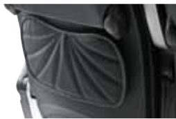
Relax GTV Zeitungshaltertasche mit Lederrändchen