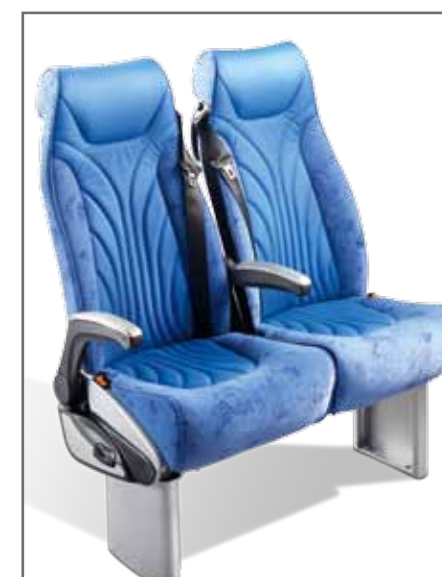
Relax GTV mit Sportsrändchen