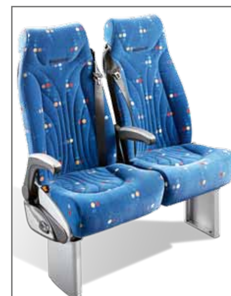
Relax GTV, Textil bezogen mit Klettband, Standard Rändchen